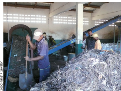
L'usine de valorisation des déchets à Mahajanga soutenue par RÉUNIR dans le cadre du programme Action Carbone

Mieux que mieux est-ce possible ? A cette question RÉUNIR répond par l'affirmative en refusant de se contenter de la compensation et en agissant au quotidien pour faire baisser les émissions du siège parisien. Un partenariat vient d'être mis en place avec l'entreprise ELISE pour le tri et la collecte du papier et des cartons. Une action qui couvre tous les aspects du développement durable car, à l'effet positif sur l'environnement, vient s'ajouter un aspect social. ELISE se concentre en effet sur l'emploi des personnes handicapées ou en difficultés professionnelles.